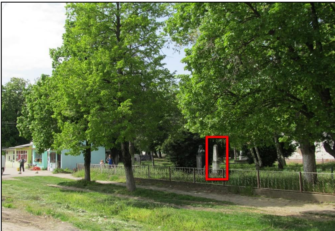
Позиција споменика у парку