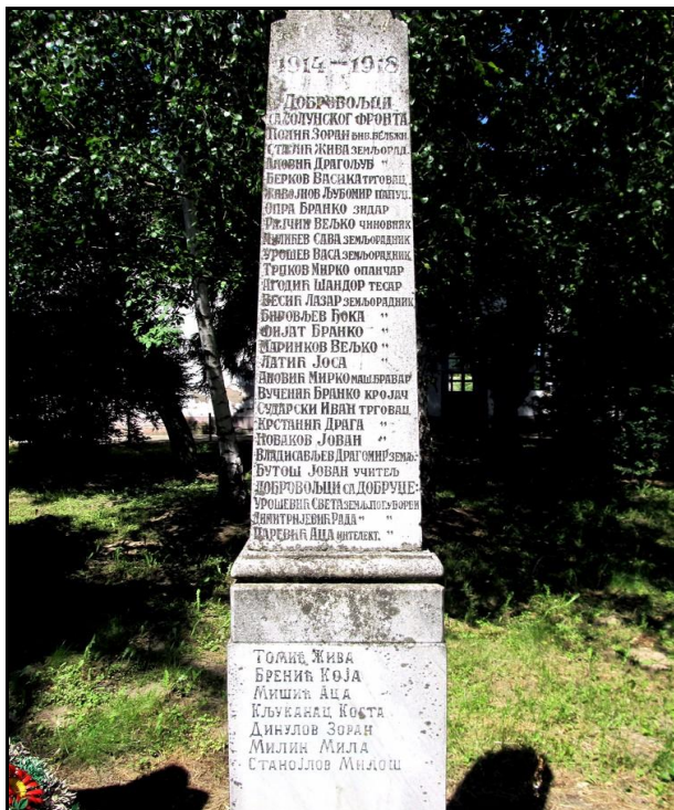
Текст на предњој страни споменика