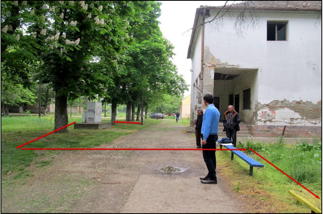
Траса електровода од изворишта ка споменику