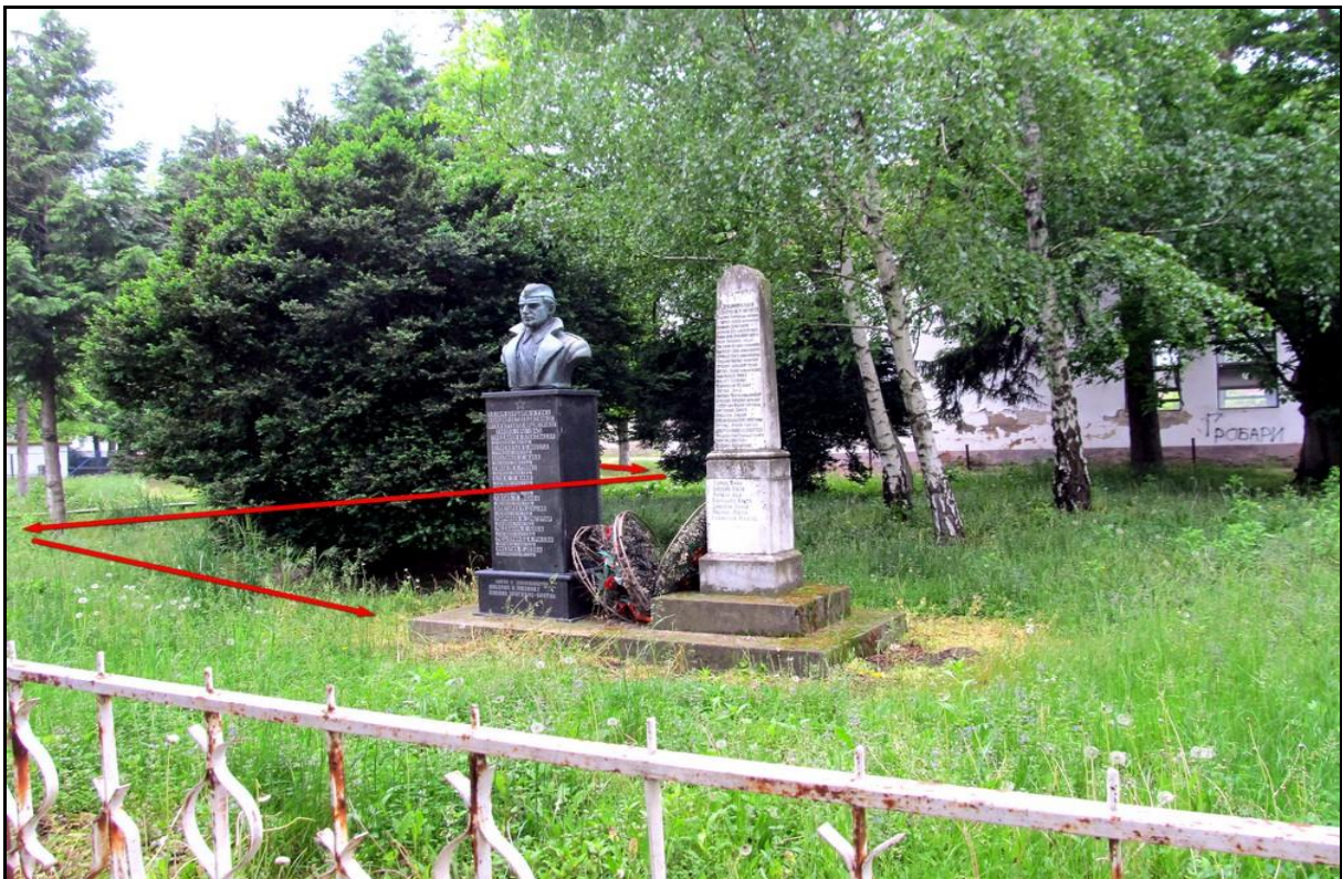
Наставак трасе електровода од изворишта до споменика