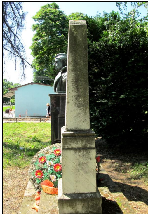
Бочна страна споменика