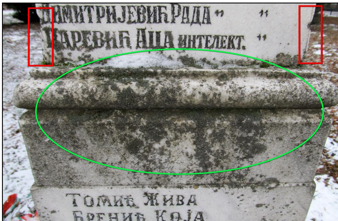
Окрзнућа (црвено) и наслаге биофилма (зелено)